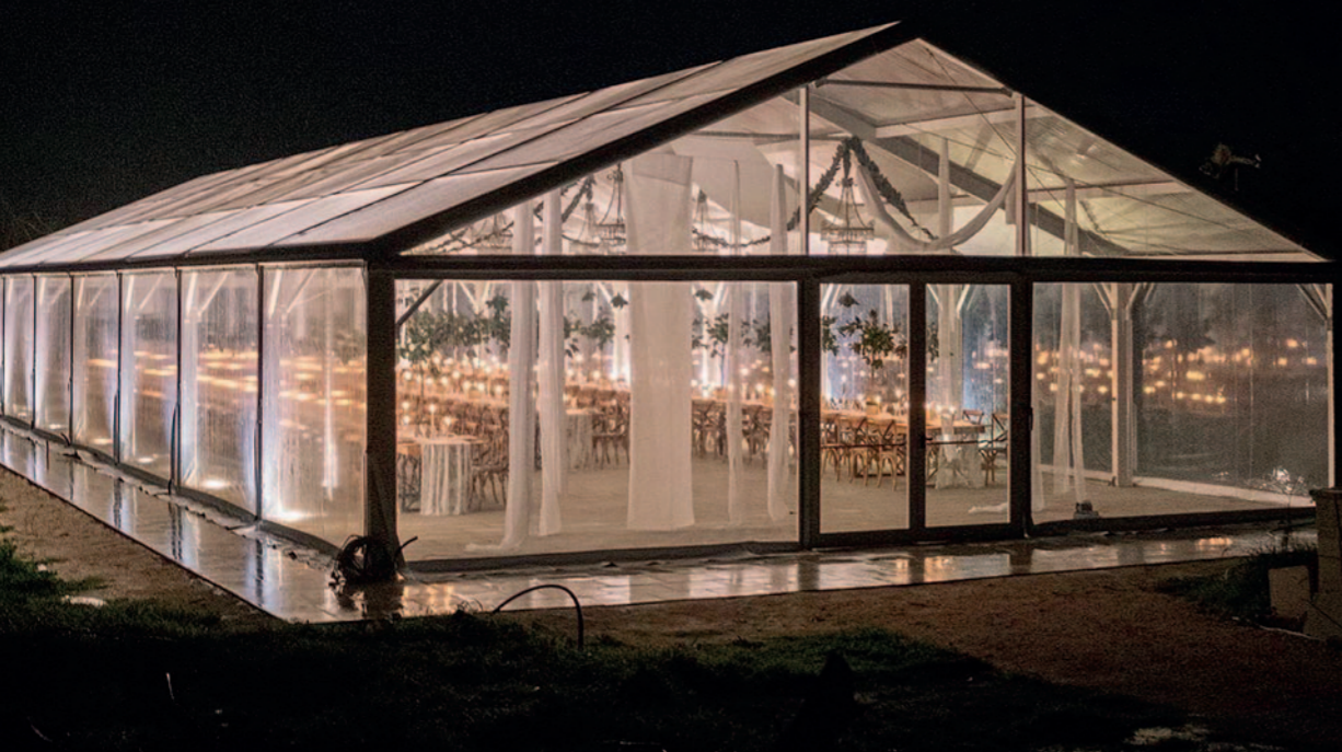
Strutture per eventi e luoghi del benessere, spa e piscine: dall'idea alla stesura del progetto, alla realizzazione lavoriamo materiali italiani, prediligendo la cura dei dettagli