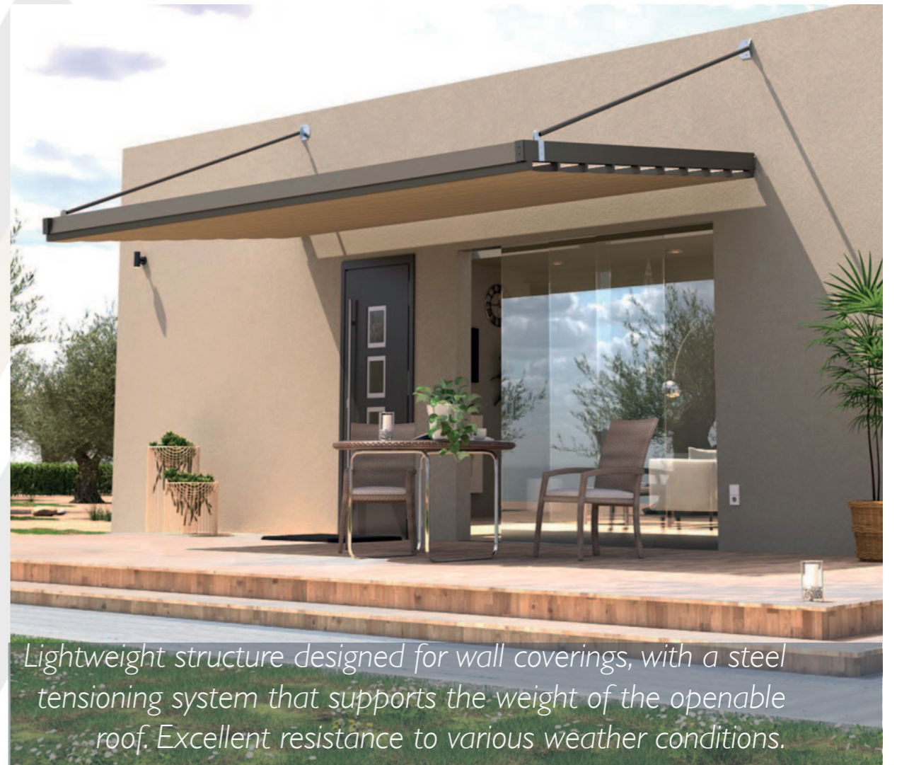
Lightweight structure designed for wall coverings, with a steel tensioning system that supports the weight of the openable roof. Excellent resistance to various weather conditions.