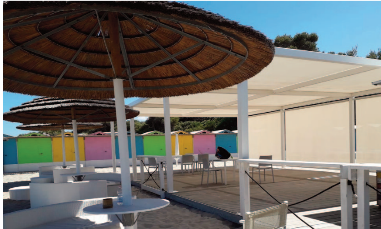
Struttura in acciaio con telo fisso in pvc microforato... Strionfo del comfort e della leggerezza.