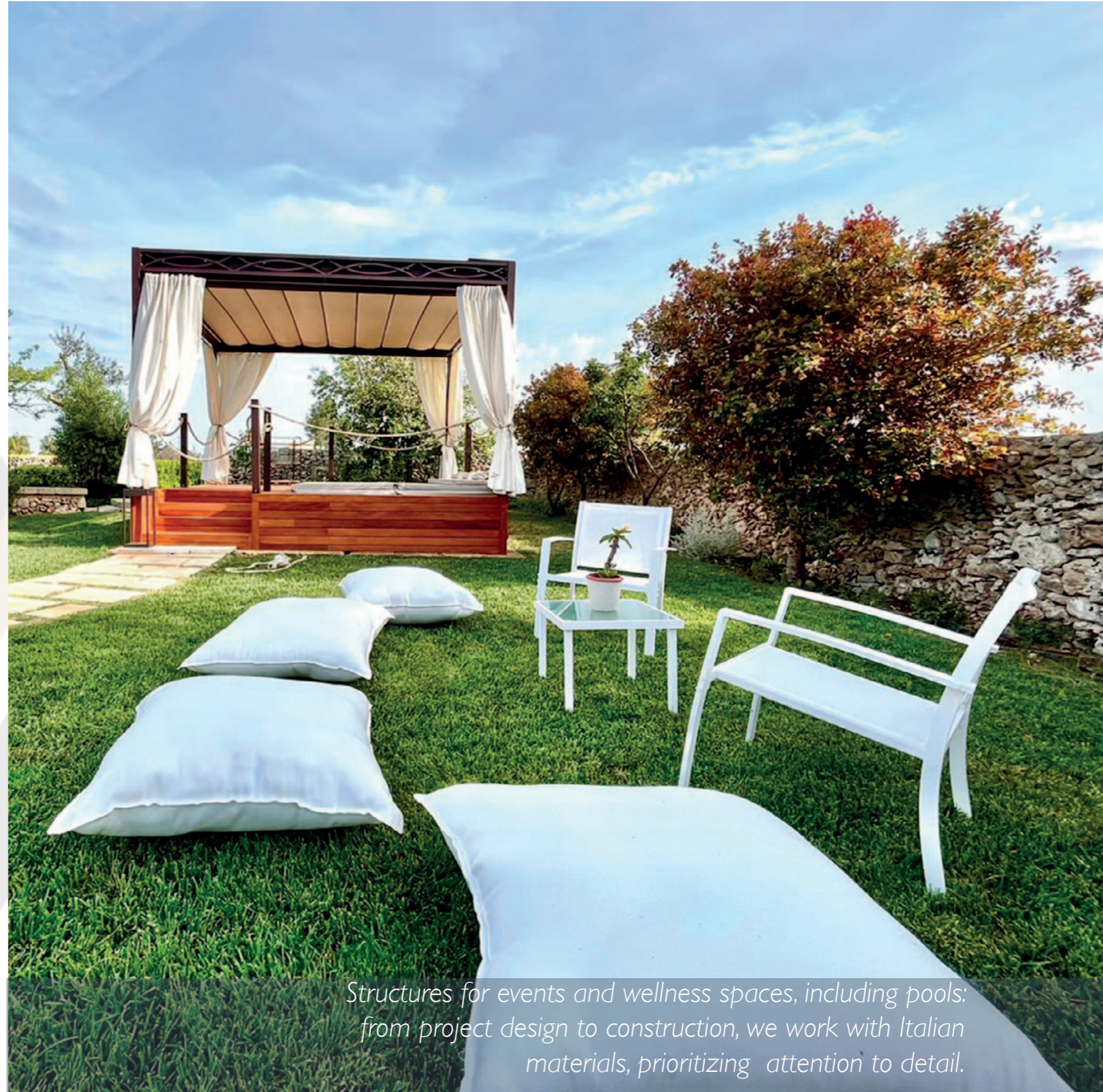
Structures for events and wellness spaces, including pools: from project design to construction, we work with Italian materials, prioritizing attention to detail.