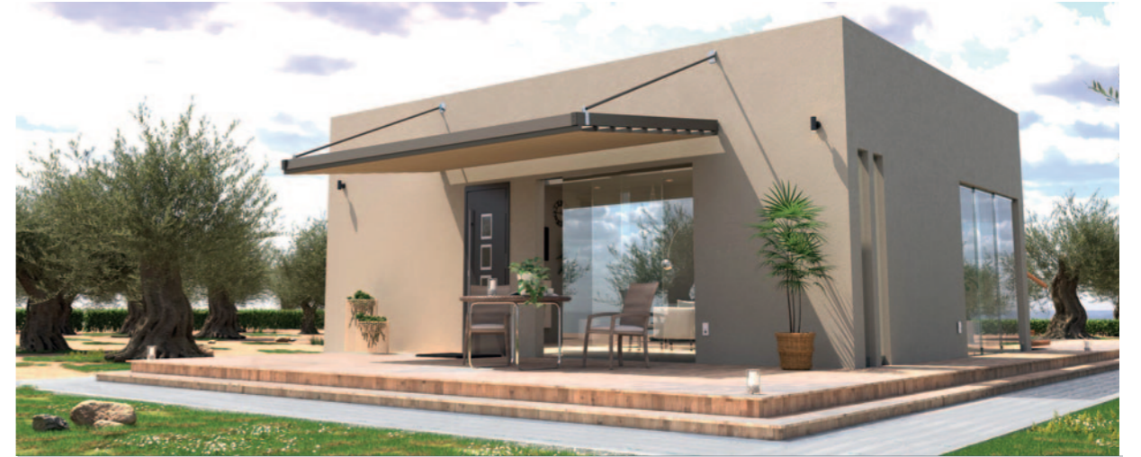
Struttura leggera ideata per coperture a muro con sistema di tiranti in acciaio che sostengono il peso del tetto apribile. Ottima resistenza alle diverse condizioni atmosferiche.