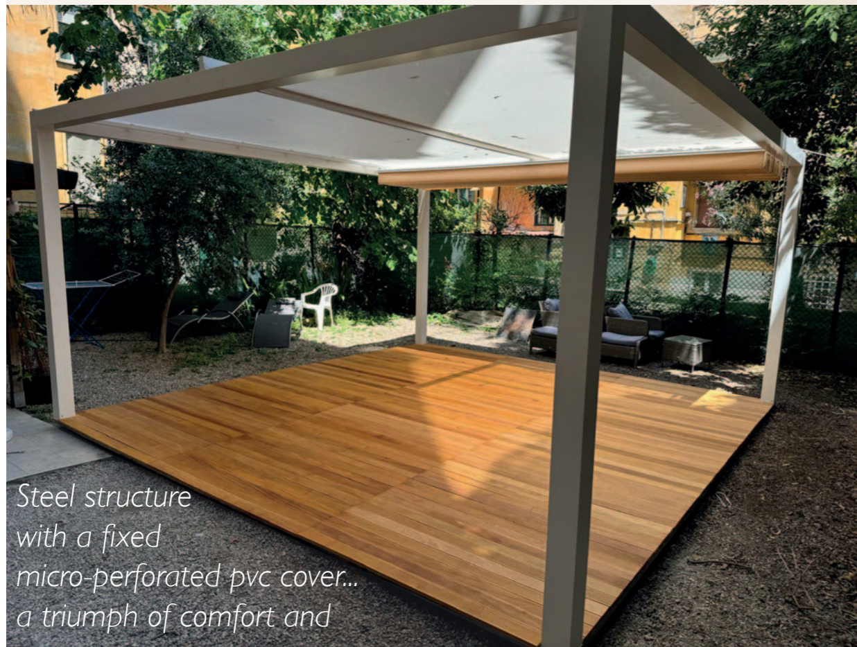
Steel structure with a fixed micro-perforated pvc cover... a triumph of comfort and